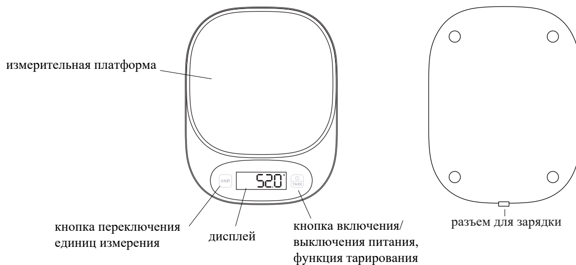
Лицевая сторона и задняя крышка